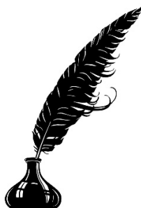
Pas de photo connue