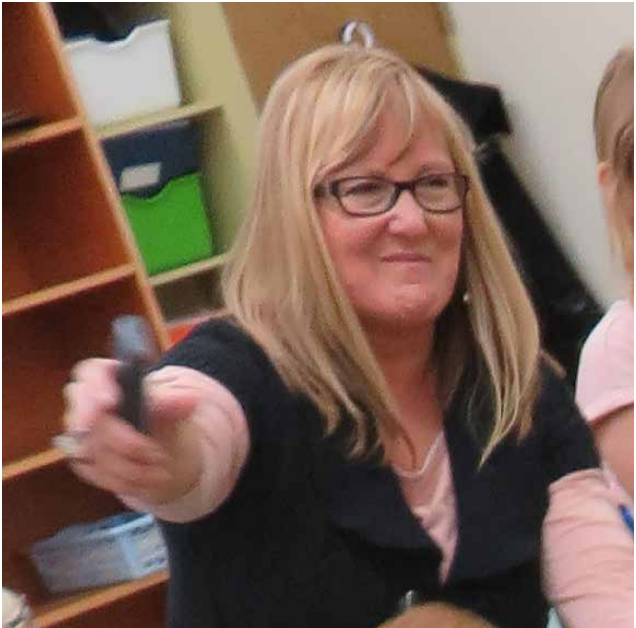
M me Isfeld va m'enseigner la musique.