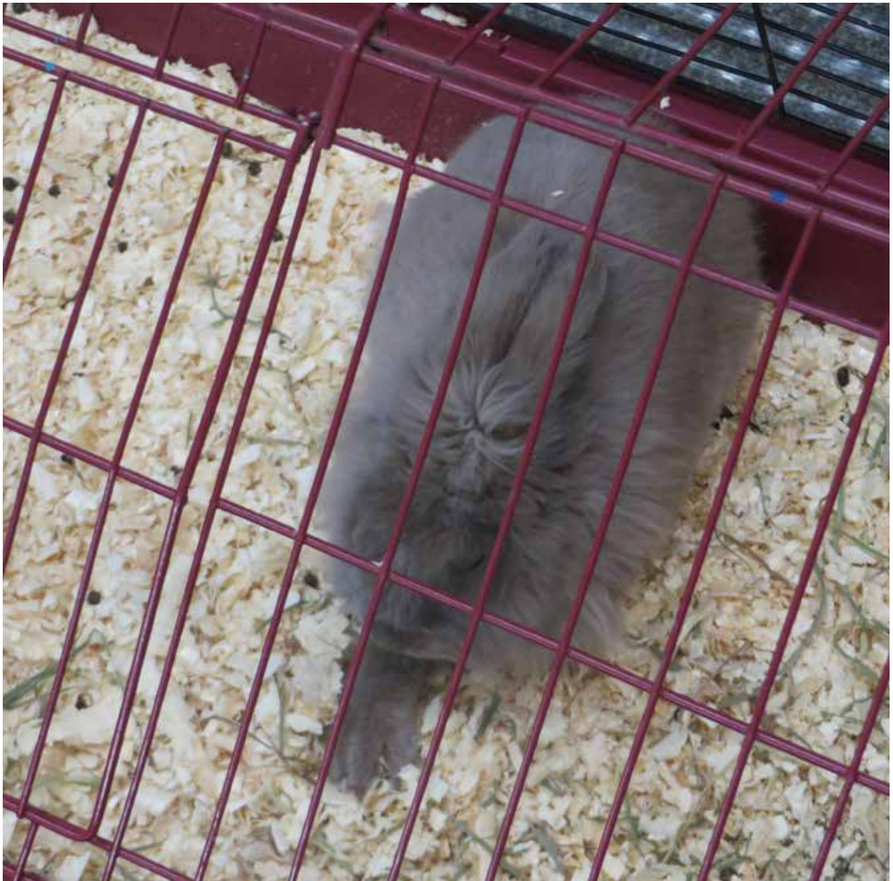
C'est Tyrone le lapin.